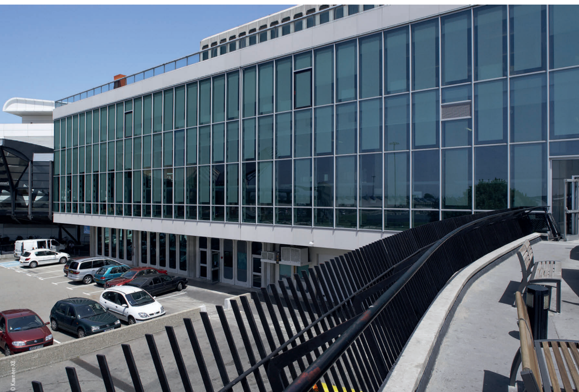
AA110, le mur-rideau Kawneer grande dimension, ici mis en œuvre à l'aéroport Lyon Saint-Exupéry (architecte Cabinet CRB Architecte).