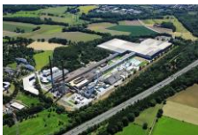
Luftaufnahme der Pilkington Deutschland AG, Werk Gladbeck.

Planen Sie ein Projekt und wünschen Beratung? Kein Problem, wir freuen uns auf Ihre Nachricht an marketingDE@nsg.com !