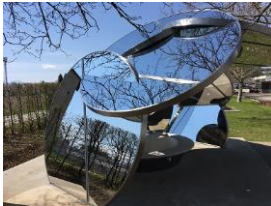
Cloudspace Pavillion, Völkermarkt, Österreich Pilkington Mirropane™ Chrome Plus