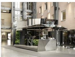
Glaskiosk, Stockholm, Schweden Pilkington Mirropane™ Chrome Plus Pilkington Mirropane™ Chrome Spy