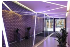
Ruhr Park Bochum Pilkington Mirropane™ Chrome Plus