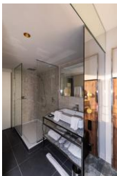
Hotel Pullman Paris Montparnasse, Frankreich Pilkington Mirropane™ Chrome Plus