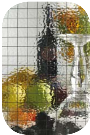
Pilkington Pyroshield Texture