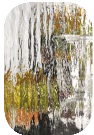
Ornamet Z (Silvit)