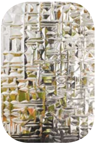
Ornement X (Abstracto)