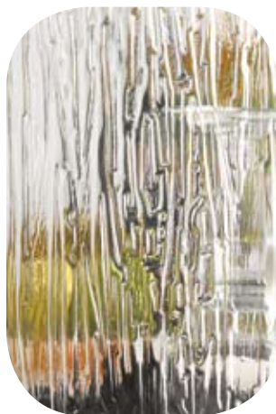
Ornamet B (Niagara)